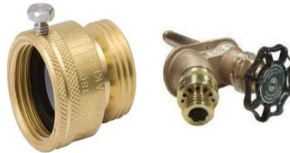
A hose bibb vacuum breaker, and a hose bibb vacuum breaker attached to a faucet.

Purchase hose bibb vacuum breakers and install on all outdoor and indoor threaded faucets. These will provide backflow prevention for garden hoses and protect the public water supply.