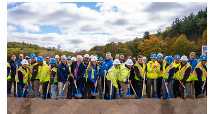
Funcionarios federales, estatales y locales se reúnen con empleados de la Comisión en la ceremonia de inicio de la nueva Planta de Tratamiento de Agua de West Parish en octubre de 2024.

La Comisión ha experimentado niveles elevados de HAA5 en el agua potable terminada desde el otoño de 2018, que presentó precipitaciones inusualmente altas. La Comisión informó por primera vez sobre un exceso del estándar de agua potable para HAA5 en enero de 2019 basado en muestreos realizados en diciembre de 2018.