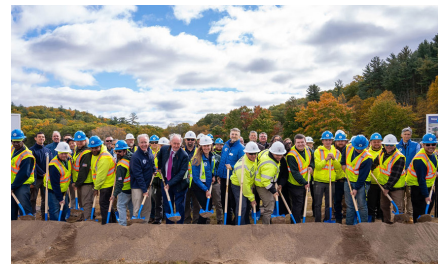
Federal, state, and local officials gather with Commission employees at the groundbreaking for the new West Parish Water Treatment Plant in October 2024.