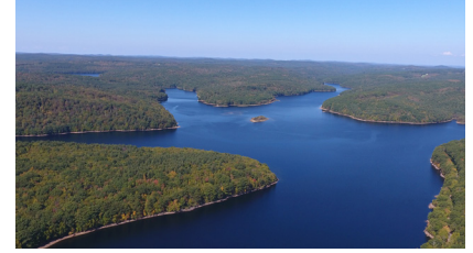
El embalse Cobble Mountain en Blandford y Granville, MA, es la principal fuente de agua potable de la Comisión.

Los ácidos haloacéticos (HAA5) son subproductos de la desinfección (DBP) que se forman cuando el cloro, utilizado para la desinfección, reacciona con la materia orgánica natural disuelta (NOM). La NOM proviene de materiales naturales del bosque, como hojas en descomposición, plantas, suelo, etc., que se lavan en todos los cuerpos de agua superficial cuando llueve. El embalse Cobble Mountain es la principal fuente de agua potable de la Comisión. Los niveles de NOM en el embalse fluctúan en respuesta a los patrones de lluvia, así como a los cambios estacionales. La tecnología de tratamiento de agua potable heredada de la Comisión (de las décadas de 1920 y 1970) no es capaz de filtrar suficiente NOM para cumplir con las regulaciones actuales de DBP.