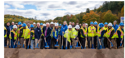
Funcionarios federales, estatales y locales se reúnen con empleados de la Comisión en la ceremonia de inicio de la nueva Planta de Tratamiento de Agua de West Parish en octubre de 2024.

La Comisión ha experimentado niveles elevados de HAA5 en el agua potable terminada desde el otoño de 2018, que presentó precipitaciones inusualmente altas. La Comisión informó por primera vez sobre un exceso del estándar de agua potable para HAA5 en enero de 2019 basado en muestreos realizados en diciembre de 2018.