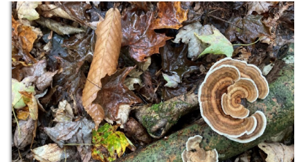
NOM en el suelo del bosque que rodea el embalse Cobble Mountain.