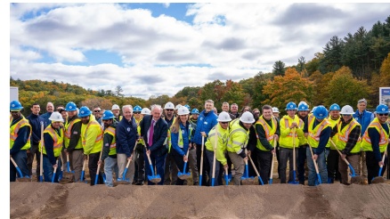
Federal, state, and local officials gather with Commission employees at the groundbreaking for the new West Parish Water Treatment Plant in October 2024.

The Commission has experienced elevated levels of HAA5 in the finished drinking water since Fall 2018, which featured unusually high precipitation. The Commission first reported an exceedance of the drinking water standard for HAA5 in January 2019 based on sampling in December 2018.