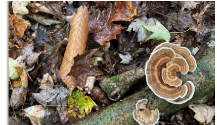
NOM on the forest floor surrounding Cobble Mountain Reservoir